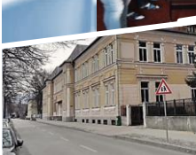
Pavilón A ulica: Školská č. 8