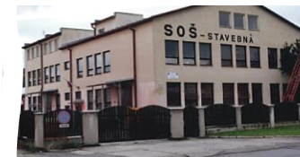
Pavilón C ulica: Družstevná č. 6