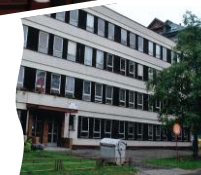
Pavilón B ulica: Jura Janošku č. 4