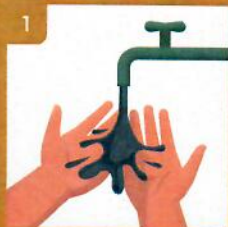
1 Zvlhčíte si ruky vodou Wet hands

How to wash your hands | Protect yourself and others