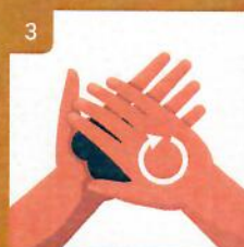
3 Mydlo rozotrite medzi rukami spôsobom dľaň o dľaň Rub hands palm to palm