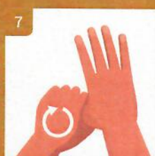
7 Krúživým pohybom si očistíte oba palce Clean thumbs