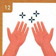
12 Vaše ruky sú čisté Your hands are clean!

Ako si dezinfikovať ruky s použitím dezinfekčného prostriedku How to use sanitation gel