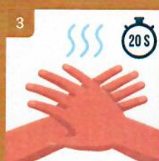
3 Akonáhle ruky uschnú, sú vydezinfikované (20 sekúnd) Cover all surfaces until hand feel dry (20 sec)

Regionálny úrad verejného zdravotníctva so sídlom v Nitre – 0948 495 915