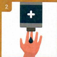
2 Aplikujte dostatočné množstvo mydla Apply soap