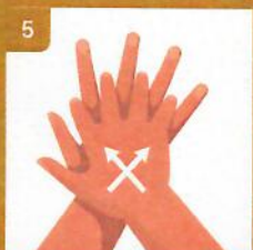
5 Trením si očistíte spojené prsty pravej ruky proti ľavej a potom opačne Scrub between your fingers