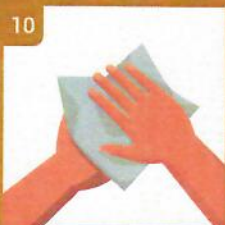
10 Dôkladne si utrite ruky jednorazovou utierkou Dry with a single use towel