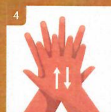
4 Preložením rúk si očistíte vnútorné strany prstov Lather the backs of your hands