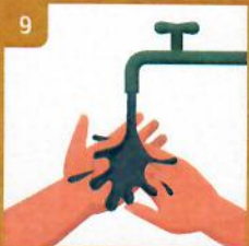
9 Opláchnite si ruky vodou Rinse with water