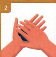
2 Prostriedok rozotrite medzi rukami spôsobom dľaň o dľaň Rub hands together