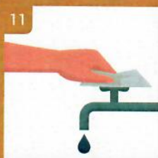
11 Použitou utierkou zastavte vodu Use the towel to turn off the faucet