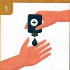
1 Naneste prostriedok na dľaň jednej ruky Apply the product on a palm of one hand