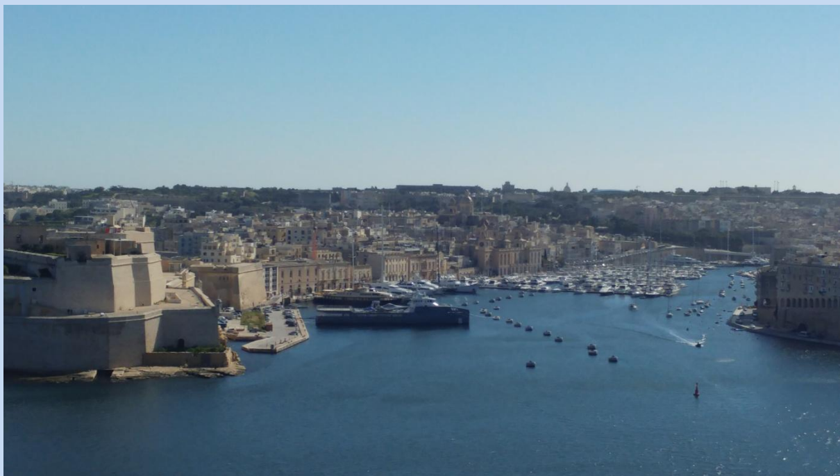
Widok na Trzy Miasta