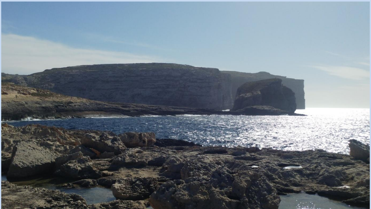
Zatoka Dwejra I widok na Fungus Rock (Grzybowa Skala)