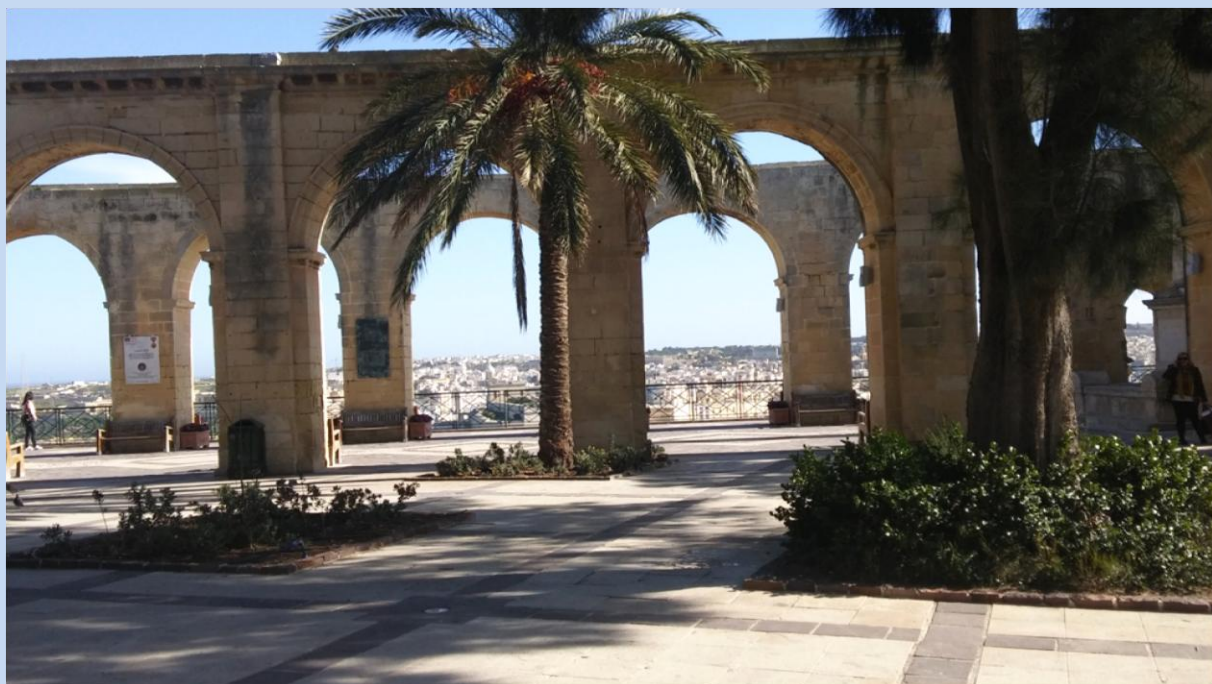
Górne ogrody Baracchi